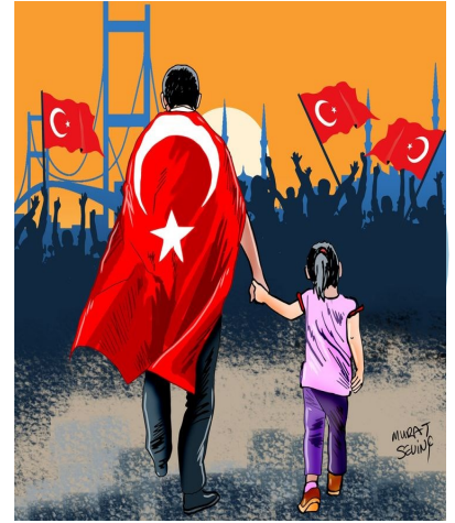
Bayrakları bayrak yapan üstündeki kandır.

16 Temmuz sabahı, Türk Silahlı Kuvvetleri ve Emniyet Genel Müdürlüğü personelinin gerçekleştirdiği operasyonlar sonucunda askerî darbe girişimi bastırıldı ve askerler silahları ile birlikte teslim oldu. Olaylar sonucunda 104'ü darbe yanlısı asker olmak üzere 300'den fazla kişi hayatını kaybetti